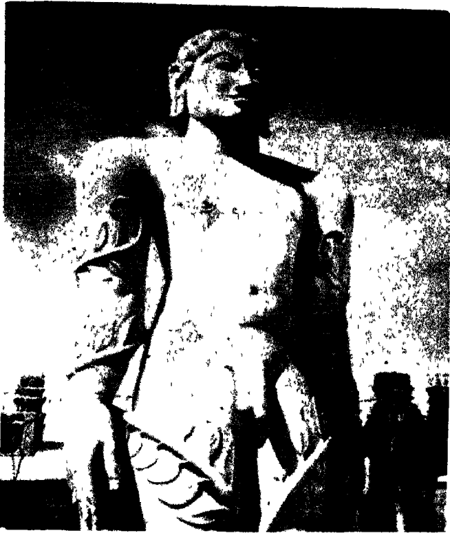
विश्व का नवां आश्चर्य, ५७ फीट ऊंची बाहुबली की मूर्ति श्रवणवेलगोल, मैसूर राज्य में उत्कीर्णित

सम्राट् ऋषभदेव के दूसरे पुत्र बाहुबली थे। वे भी भरत की भाँति प्रतापी थे। उनका जन्म ऋषभदेव की द्वितीय पत्नी सुनन्दा से हुआ था। उनका शरीर कामदेव के समान सुन्दर था। इसी कारण वे गोम्भटेश कहलाते थे। वे दृढ तपस्वी और मोक्षगामी महासत्त्व थे। उनकी राजधानी तक्षशिला (पोदनपुर) में थी।